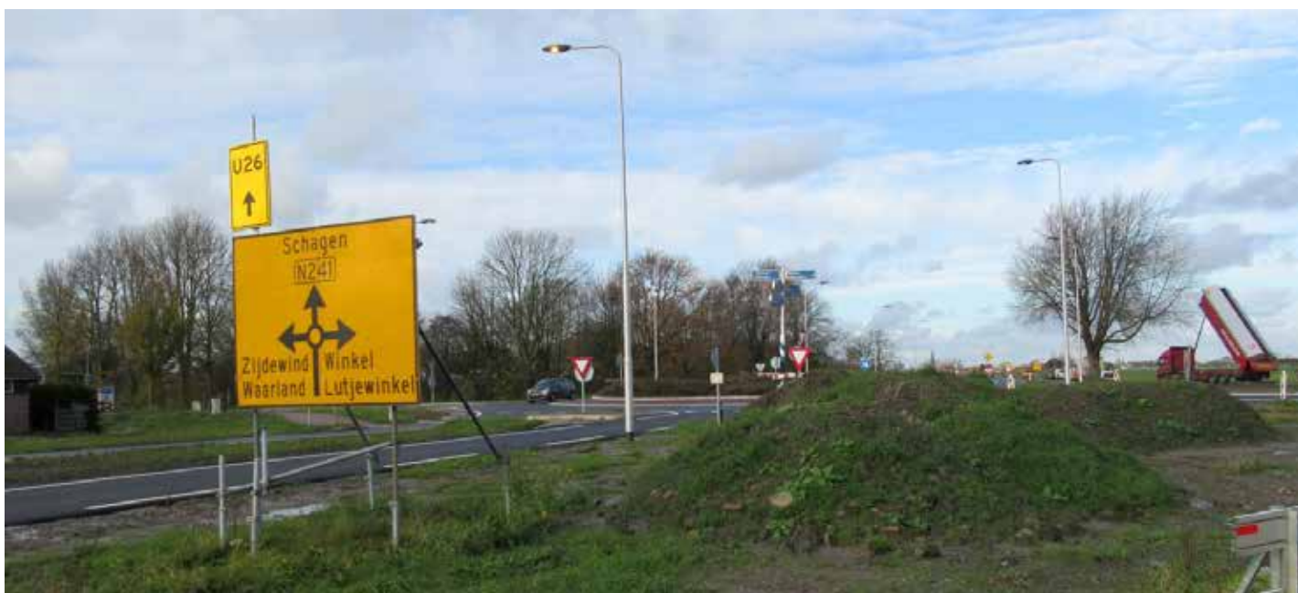
Tijdelijke bewegwijzering N241-Hartweg-Zandweg (november 2017)

geplaatst. De tijdelijke (gele) bewegwijzeringsborden blijven tot die tijd langs de weg staan. Ook al zijn het er maar een paar.