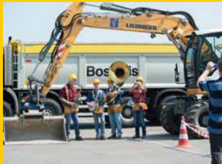
Dag van de Bouw 2016