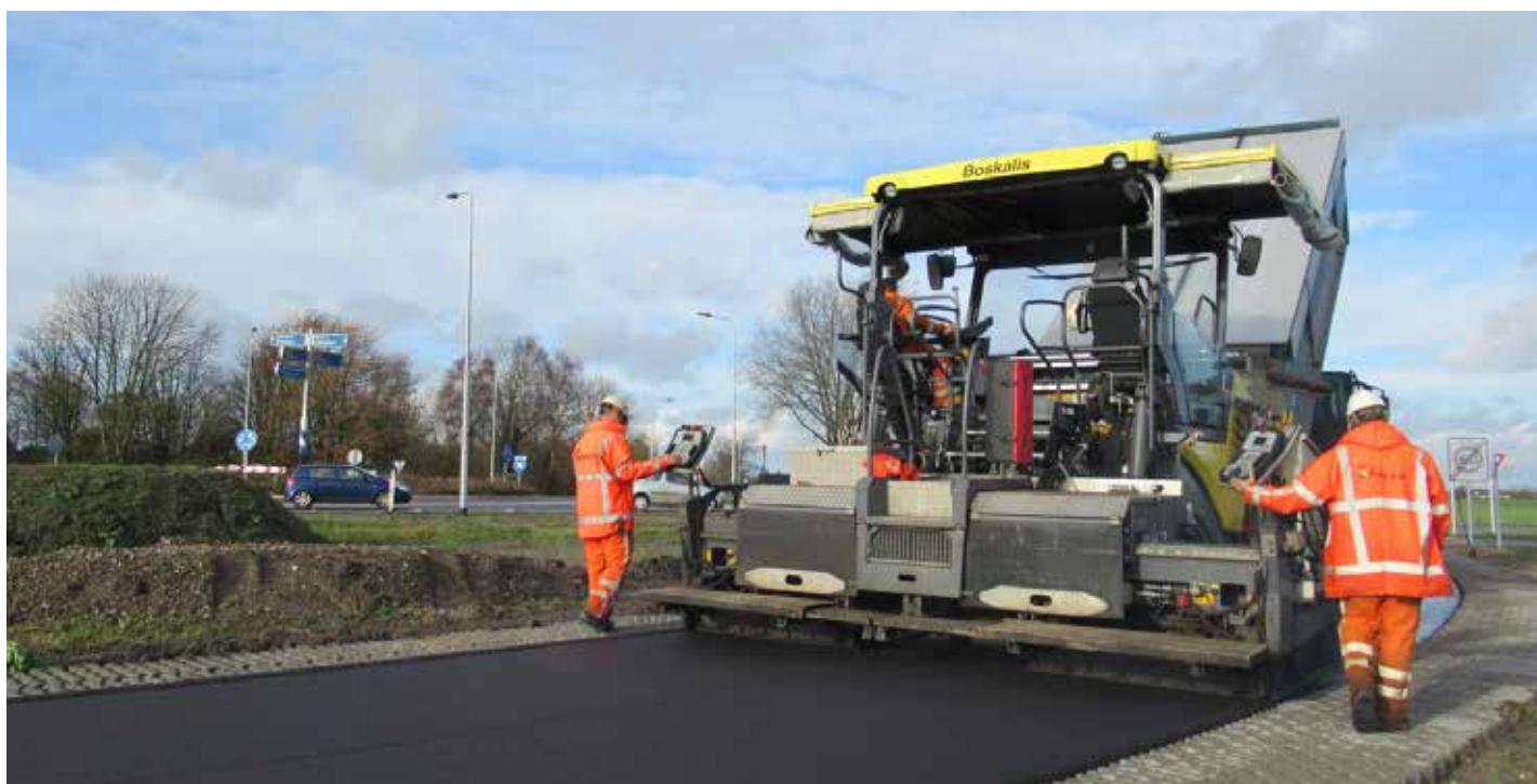
Asfalteren parallelweg

Dit waren de laatste asfalteringswerkzaamheden. Alle wegen zijn nu in gebruik en vernieuwd!