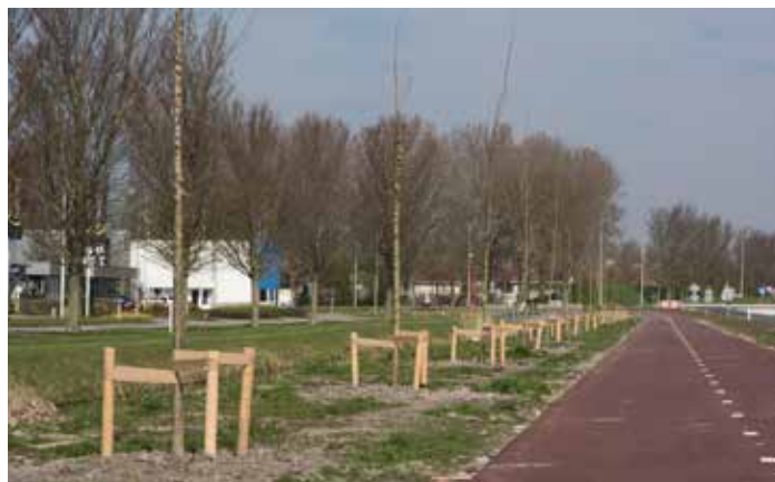
Iepen ter hoogte van bedrijventerrein Witte Paal, in het voorjaar geplant

Nu de wegen definitief zijn aangelegd en het plantseizoen is aangebroken kunnen de hagen en bomen geplant worden. Op 6 november is hiermee gestart vanaf de kant van Schagen en wordt richting het Verlaat gewerkt. De hagen komen aan weerszijden van de N241. Dus tussen de hoofdrijbaan en fietsstraat/het fietspad. En tussen de hoofdrijbaan en parallelweg. De iepen ter hoogte van bedrijventerrein Witte Paal waren in het voorjaar van 2017 al geplant. Naar verwachting lukt het niet om alle bomen dit jaar nog te planten. De hagen richting Verlaat worden dan begin volgend jaar geplaatst.