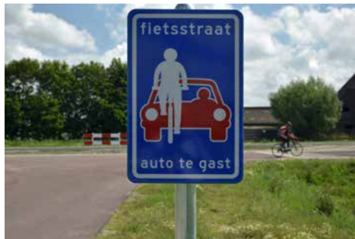
Fietsstraat langs N241, auto's zijn hier te gast (oktober 2017)

De fietsstraat is een weg die ingericht is als fietsroute en waar auto's te gast zijn. Eerder heeft de provincie een fietsstraat aangelegd bij het Verlaat (kruising N242/N241). Vanuit de omgeving zijn daar in het begin klachten over geuit. Vooral de ribbel in het midden van de fietsstrook werd als ongewenst en gevaarlijk ervaren. Dat heeft ervoor gezorgd dat de provincie het ontwerp van de fietsstraat langs de N241 enigszins heeft aangepast. De ribbelstrook in het midden van de fietsstraat is aangepast en op het drukste gedeelte is een apart fietspad aangelegd. Nu de fietsstraat in gebruik is ontvangen wij klachten dat er door het autoverkeer te hard over de fietsstraat wordt gereden. En dat ook via de berm de N241 wordt opgereden in plaats van de fietsstraat uit te rijden tot de rotonde. Eerdere maatregelen die in de tijdelijke situatie getroffen konden worden hielden geen stand. Zo zijn nood- en hulpdiensten niet blij met tijdelijke drempels en is het afzetten van de bermen met paaltjes en draden niet geschikt voor motorrijders. Om te kijken of in de definitieve situatie iets veranderd moet gaan worden zijn in november tellussen geplaatst op de fietsstraat. Daarmee kan gemeten worden hoeveel verkeer er over de