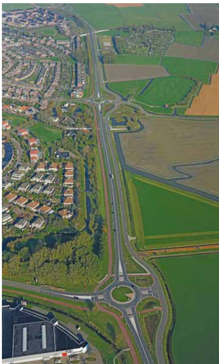
Luchtfoto N241 ter hoogte van de Zuiderweg (oktober 2017)

Inmiddels zijn we ruim een half jaar verder, sinds de vorige nieuwsbrief. En dat is buiten ook goed te merken. Het einde van het project Herinrichting Provincialeweg (N241) tussen Schagen en Verlaat is in zicht! De herinrichting tussen de Lasschoterbrug en de Moerbeek was al langer klaar. Inmiddels zijn ook de fietsstraat en parallelweg door aannemer Boskalis aangelegd en alle zes de rotondes gebouwd. De vernieuwde hoofdrijbaan van de N241 is sinds 2 oktober over de gehele lengte in gebruik. Sinds 8 december is de hele nieuwe N241 in gebruik. Er vinden wel nog enkele afrondende werkzaamheden plaats, maar met minimale hinder. In deze laatste nieuwsbrief daar meer over! Ik wil u hartelijk bedanken voor uw interesse, uw begrip en uw geduld tijdens de werkzaamheden afgelopen jaren. We hebben, en met name aannemer Boskalis, ons best gedaan om de overlast tot een minimum te beperken maar realiseren ons dat bouwen toch de nodige hinder geeft. We bedanken u daarvoor graag persoonlijk tijdens de officiële opening in het nieuwe jaar.