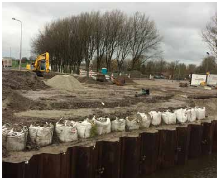
N241 Langereis (december 2017)