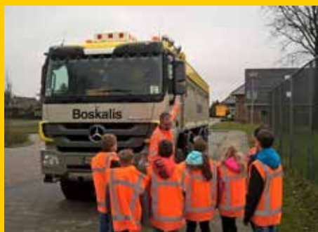
Voorlichting dodehoekspiegel basisschool De Snip