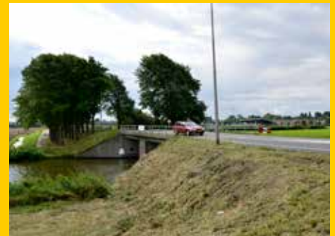
De oude Lasschoterbrug