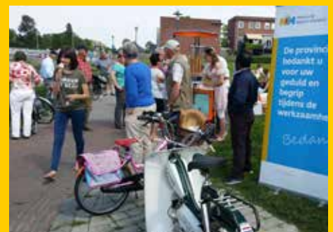
Ijsjes uitdelen bij ingebruikname tunnel Nes