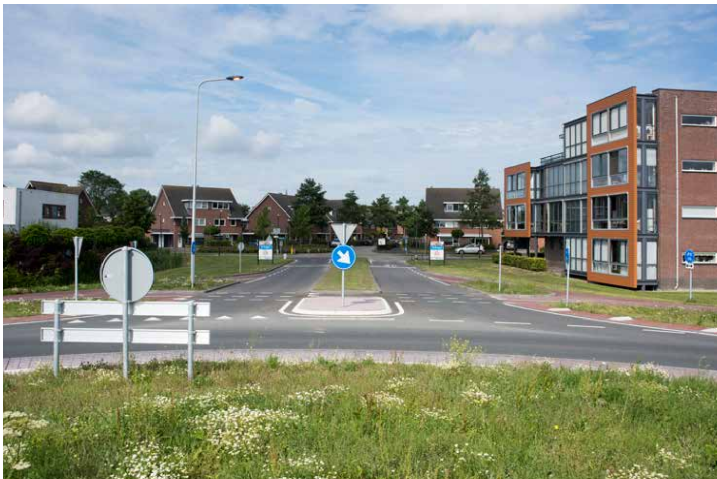
Woningen vanaf rotonde N241- Kogerlaan (juli 2017)

u verbeterpunten? Om die reden willen wij u vragen een tevredenheidsonderzoek in te vullen. Wellicht heeft u de vragenlijst per post ontvangen, anders kunt u deze ook digitaal invullen via www.noord-holland.nl/N241 . Wij willen graag de informatievoorziening zoveel mogelijk afstemmen op uw behoefte. Wij zouden het daarom enorm waarderen als u hieraan wilt meewerken.