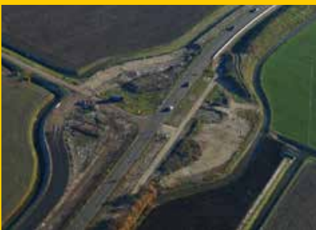
Start bouw rotonde Moerbeek