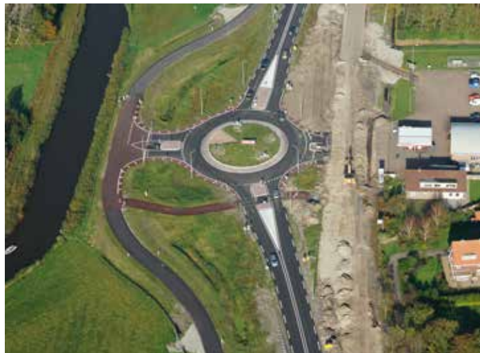
Nieuwe rotonde N241 bij 't Veld hier nog in aanbouw (oktober 2017)

Rechtstreeks de N241 op- en afrijden is ook hier niet langer mogelijk. Het verkeer kan via de rotondes de Provincialeweg (N241) bereiken zoals dat inmiddels op het hele traject van de N241 tussen Schagen en Verlaat geldt.