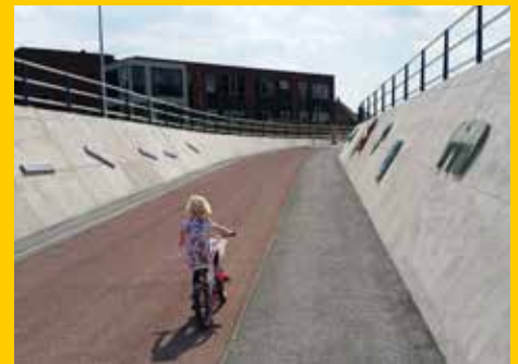
Kunstproject Monster van Nes in tunnel