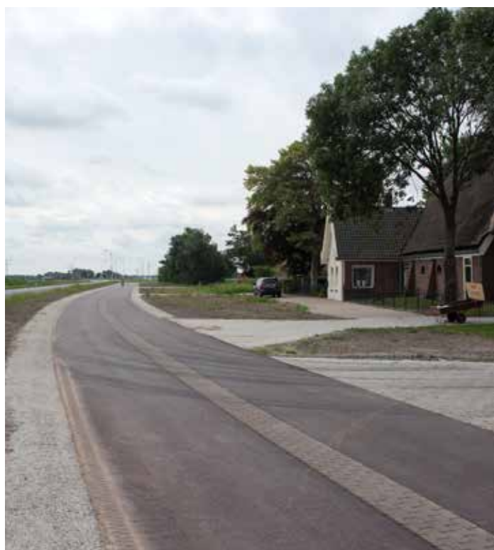
Fietsstraat (juli 2017)

Met de herinrichting van de N241 zijn op een aantal plekken lantaarnpalen verwijderd die ook niet meer terug komen. Voor de fietsstraat tussen de rotonde 't Veld tot aan de Havenstraat 1 in Zijdewind maakt de provincie een uitzondering en plaatst hier lantaarnpalen terug. De provincie maakt steeds een weloverwogen beslissing om verlichting wel of niet (terug) te plaatsen. Naast het zorgdragen voor een goede verkeersveiligheid houdt de provincie daarbij rekening met verschillende aspecten waaronder het milieu. Het beleid van de provincie is om buiten de bebouwde kom op rechte stukken weg geen verlichting te plaatsen. Maar ter hoogte van de rotondes, kruisingen en (onoverzichtelijke) bochten komt er wel verlichting. Vanuit de omgeving zijn diverse verzoeken ingediend om extra verlichting te plaatsen langs de fietsstraat en parallelweg. Alleen op basis van de verkeersintensiteit kan nog een uitzondering gemaakt worden om toch verlichting te plaatsen. Op de fietsstraat zijn daarom tellussen geplaatst om het aantal fietsers dat ervan gebruik maakt te meten. Zodra de uitkomst van het onderzoek bekend is komt dit op de website te staan.