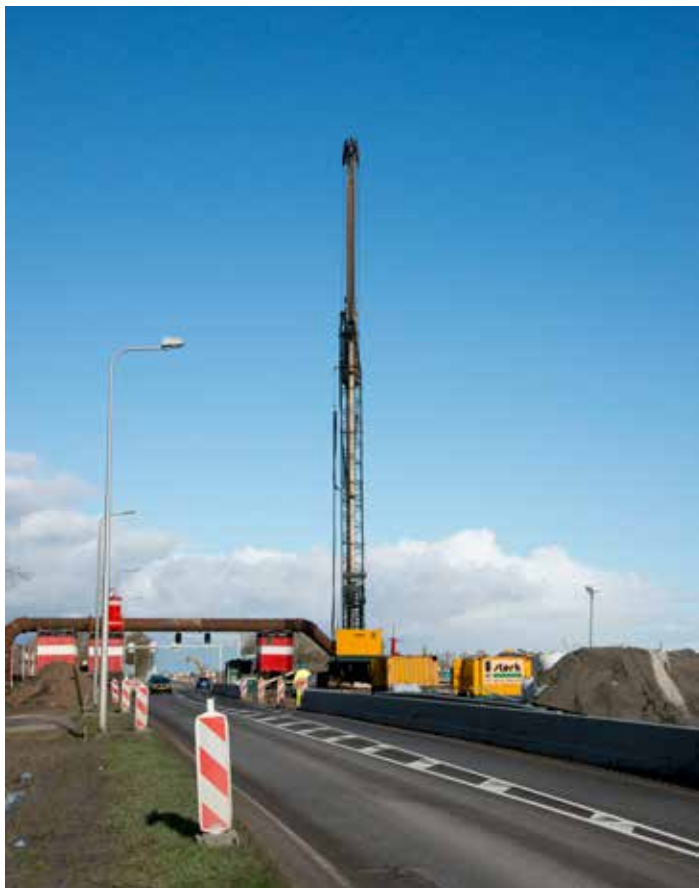
Hevelconstructie N241 (januari 2016)

Het werk aan de ovonde Langereis (N241) vordert gestaag. Goed te melden is dat de werkzaamheden nog steeds volgens planning verlopen. De afgelopen maanden is er hard gewerkt; van het slopen van bruggen tot nieuwe opbouw ervan, van asfalteren tot het plaatsen van damwanden. De ovonde neemt steeds meer vorm aan. Daarbij staat veiligheid voor zowel de weggebruikers als omwonenden en wegwerkers voorop. Op naar een fraai en veilig eindresultaat in de zomer van 2018! Meer lezen? Volg de werkzaamheden ook via de Facebook-app ( facebook.com/N241Langereis/ ).