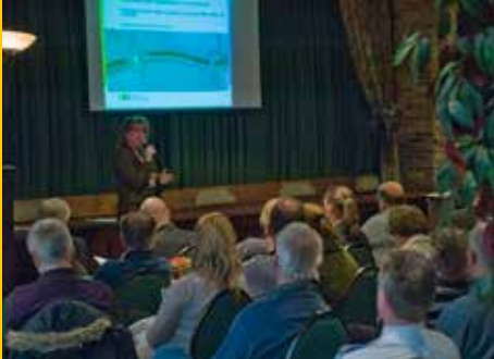
Informatieavond 30 maart 2011