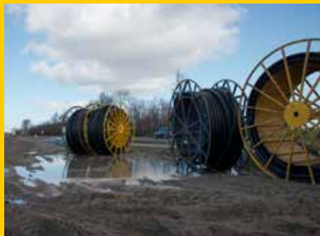
Haspels met kabels voor N241