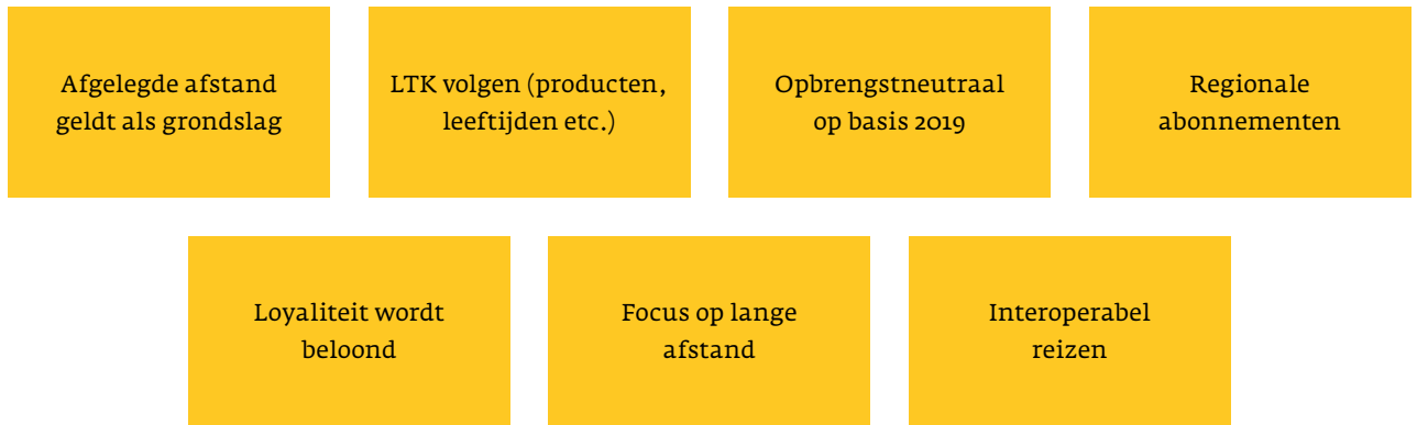
Figuur 1. De hoofduitgangspunten die worden gehanteerd bij het bepalen van producten en tarieven