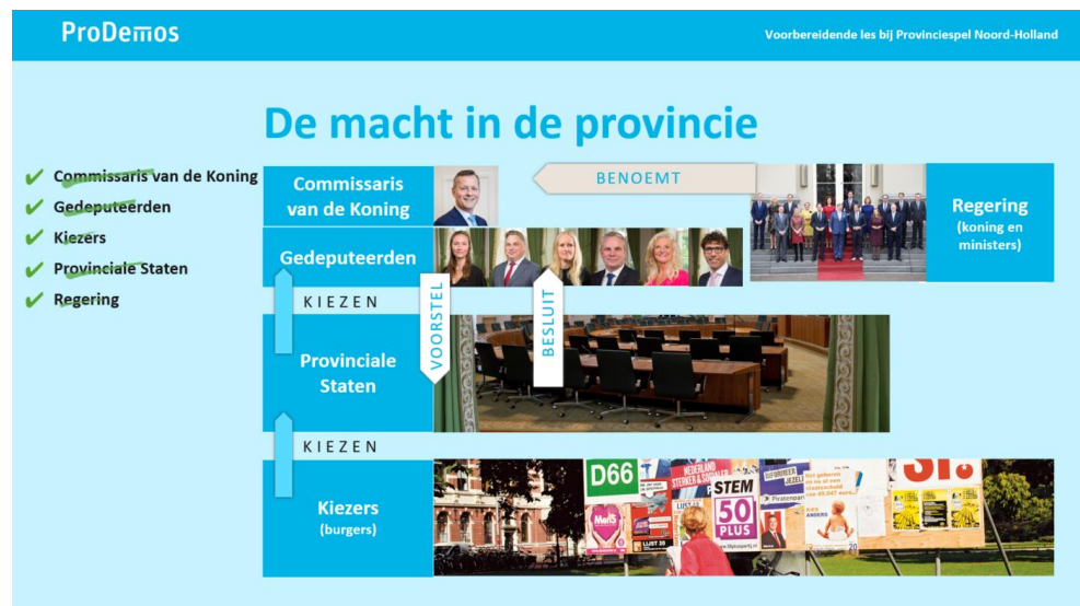
Dia 4, ingevuld