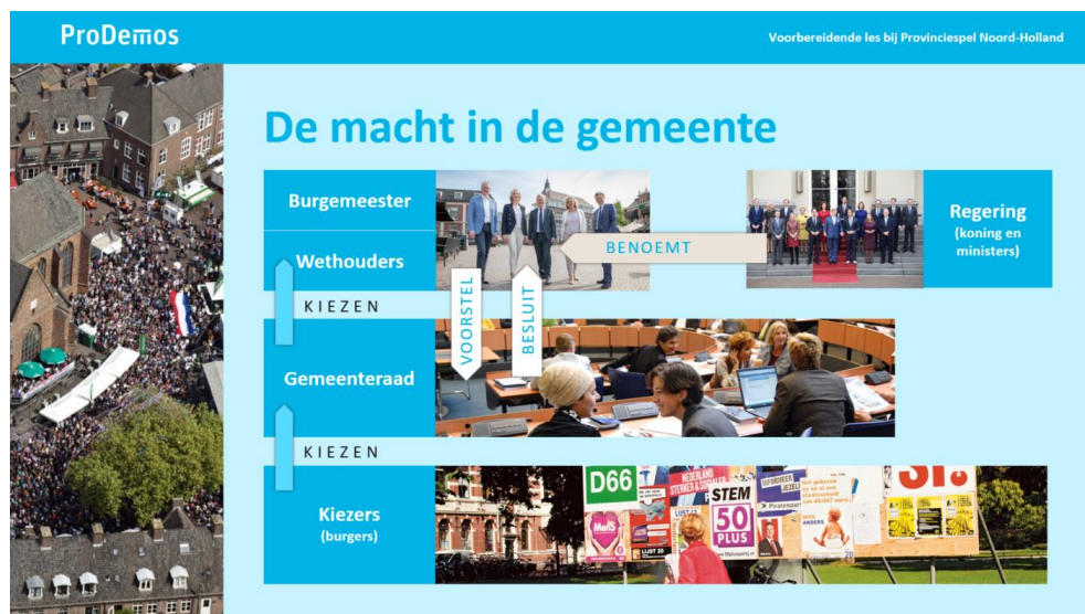
Dia 3, ingevuld