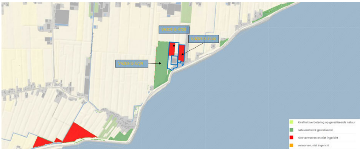
■ Natura 2000-gebied Markermeer & IJmeer ■ NNN-gebied W11 Putten van Oosterleek en Kleiput De Nek