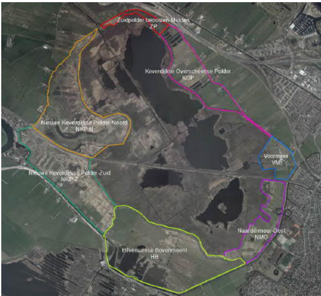
Figuur 1: Kaart Schil Naardermeer met in kleur de verschillende deelgebieden.