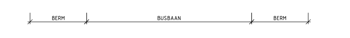
PRINCIPEPROFIEL 1A SCHAAAL 1:100 PROFIEL DOOR WONGEBIED TEN NOORDEN VAN LISSERWEG - IJWEG