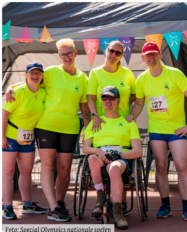
Foto: Special Olympics nationale spelen

De provincie draagt bij aan de een inclusief sportklimaat. We willen samen met betrokken partijen een omgeving creëren waarin iedereen de mogelijkheid heeft om deel te nemen aan sport, ongeacht achtergrond, capaciteiten of beperking. Dit houdt in dat barrières voor deelname worden verminderd of weggenomen, zodat sport openstaat voor een diversiteit aan deelnemers.