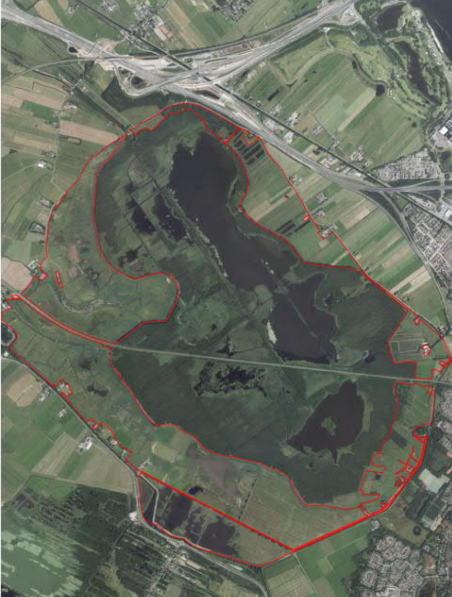
Figuur 2.1: Luchtfoto Schil Naardermeer. Rood is de begrenzing van het projectgebied van het inpassingsplan.