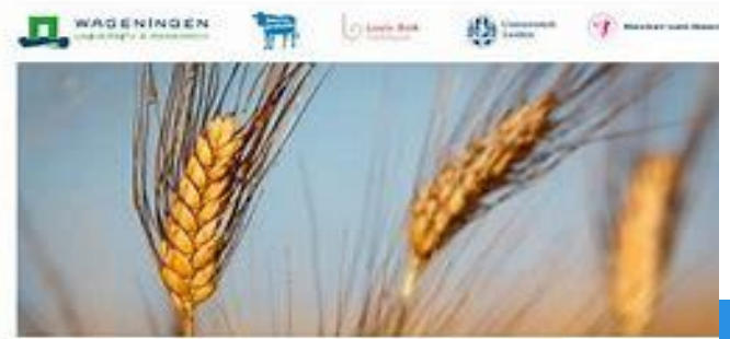
Wageningen Environmental Research | White paper