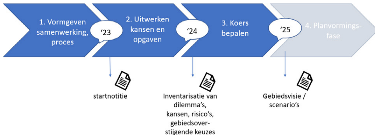
Figuur 2: processtappen verkenningfase Zuid-Kennemerland

Op basis van de brede inventarisatie in de tweede stap is duidelijk wat de bestuurlijke dilemma's zijn die vragen om een koersbepaling in de binnenduinrand, inclusief de termijn en het schaalniveau waarop de keuze gemaakt moet worden. Afhankelijk van de mate van onzekerheden over doelen, kaders en middelen zal bepaald worden of toegewerkt wordt naar een of meerdere gebiedsvisies of gebiedsscenario's. Het uitgangspunt is de behoefte vanuit deelgebieden om tot goede plannen en maatregelen te komen.