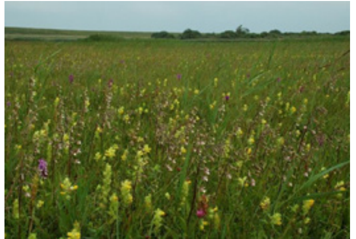
Einddoel: vochtig hooiland