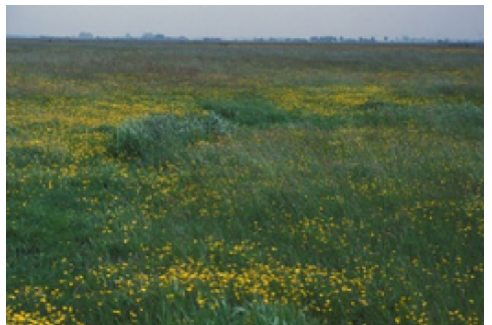
Einddoel: kruiden- en faunairijk grasland