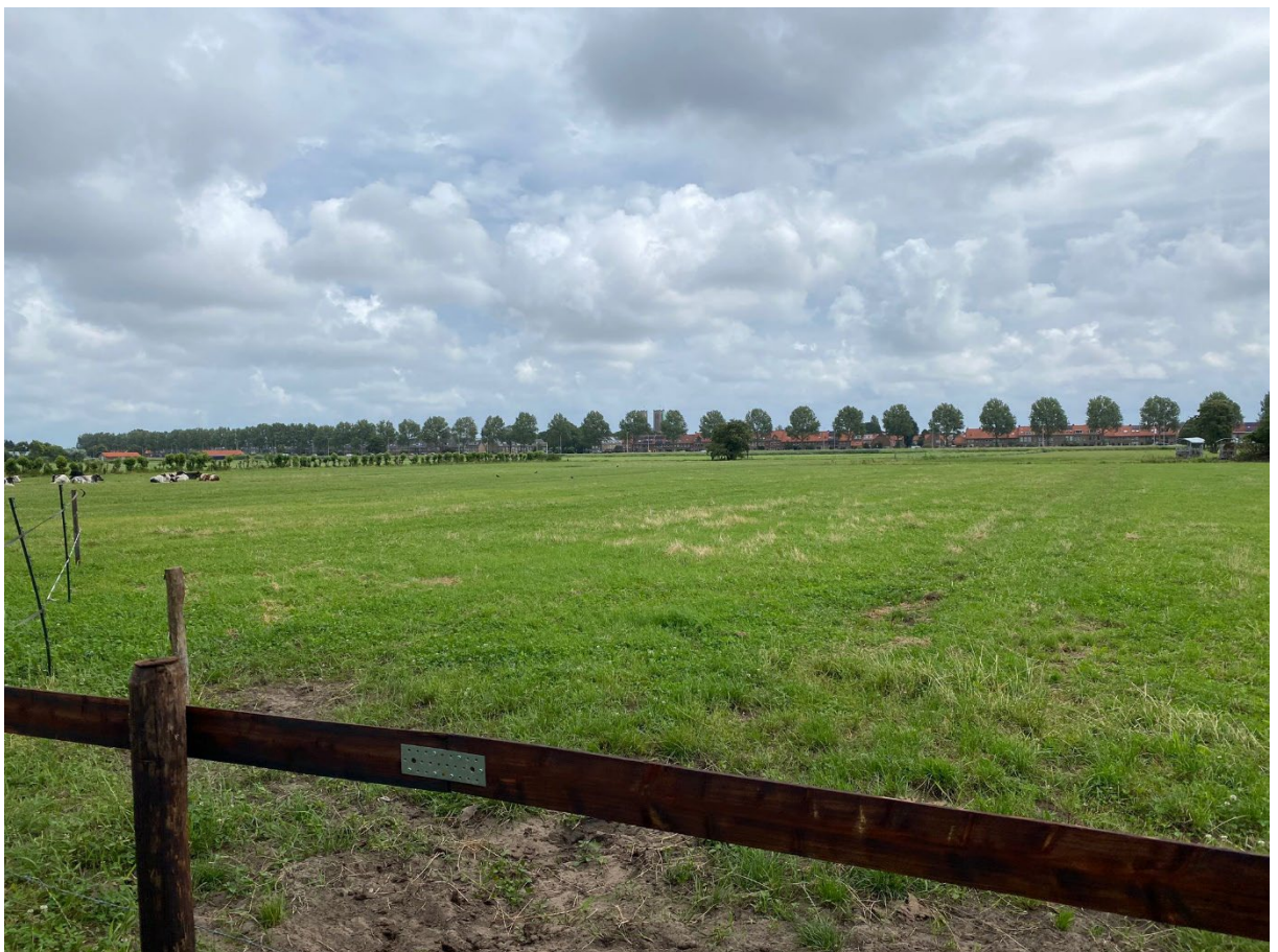
Zogenaamd gerealiseerde NNN in Haarlem

Deze foto is van het stuk land en hoewel de agrarische functie is geschrapt, ziet het er gewoon uit als landbouwgrond, wordt er niks gedaan aan NNN-natuurbeheer, maar staat het wel in de boeken als NNN-gebied, terwijl het eerder genoemde beheerde gebied met de ooievaars niet als NNN-gebied wordt gezien.