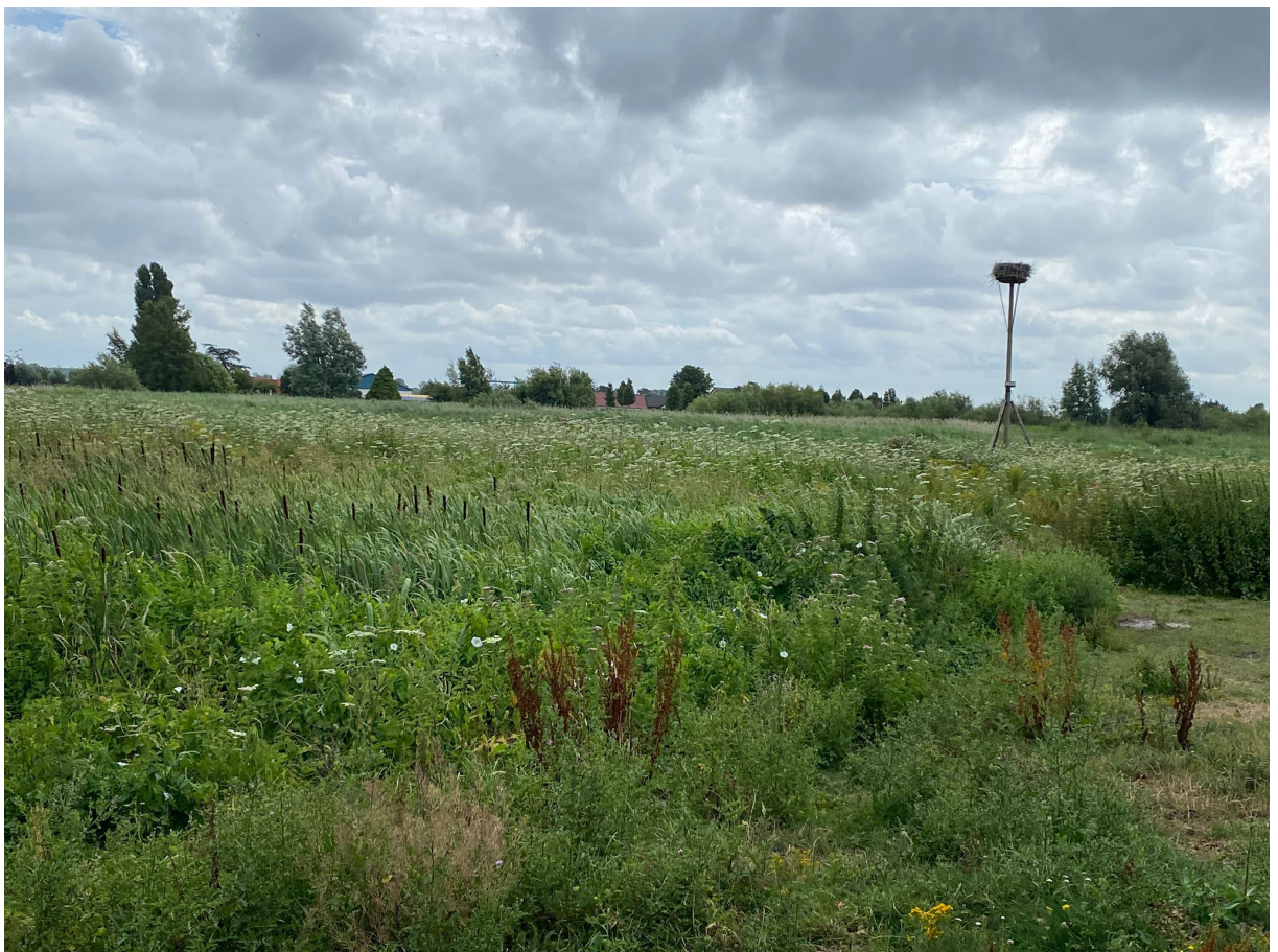
Perceel grond in Heemstede met ooievaarsnest: dit is niet als NNN bestempeld

Tijdens het werkbezoek kwam onze fractie langs een stuk weiland in Heemstede waar al jaren een ooievaarsprogramma gaande is. Meer natuur kun je bijna niet voorstellen. Dit gebied wordt in zekere zin beheerd als een NNN-gebied, maar niet als zodanig erkend.