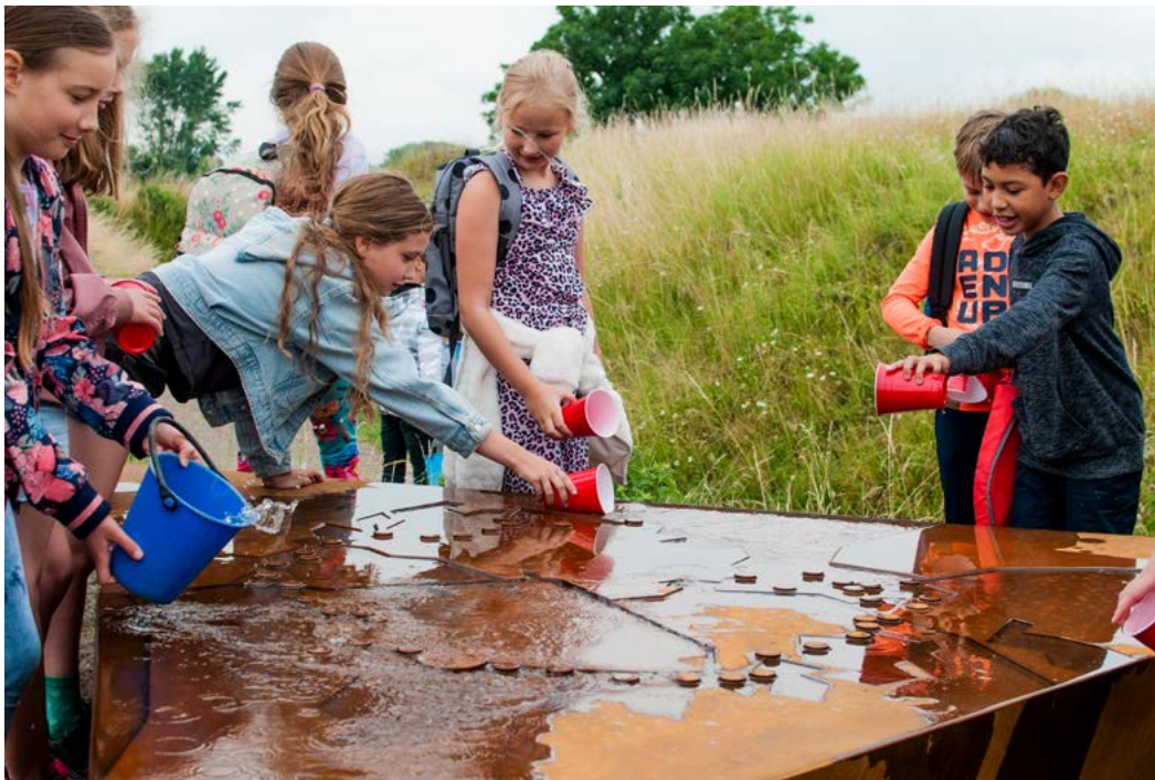
Opening Stellingtafel Fort van Hoofddorp