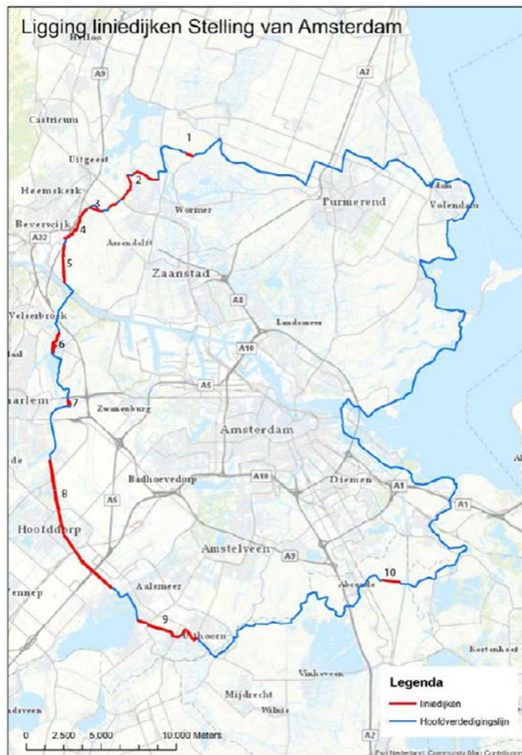
Kaart liniedijken