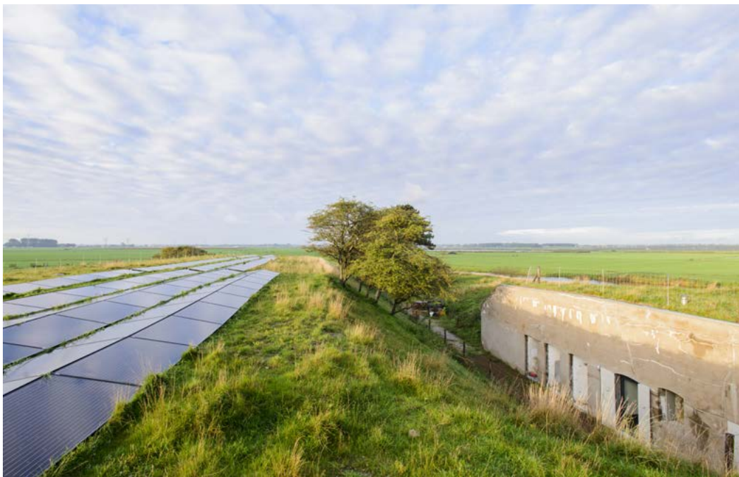
Zonnepanelen op Fort bij Krommeniedijk

Met het realiseren van de ambitie en doelen uit dit uitvoeringsprogramma bereiken we een eindbeeld voor de Hollandse Waterlinies: restauratie, consolidatie en herbestemmingsopgaven zijn voltooid, de ruimtelijke bescherming is geoptimaliseerd en het brede verhaal van het werelderfgoed staat zodanig op de kaart, dat het werelderfgoed optimaal beleefbaar is.