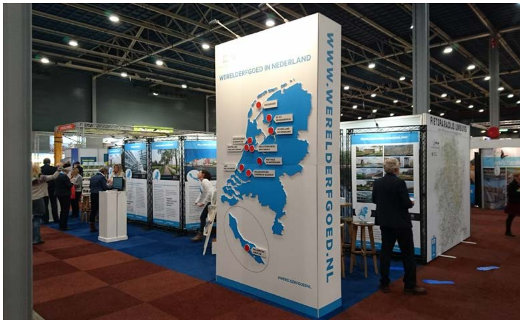
Fiets- en Wandelbeurs in Utrecht, 2017

aan wat dit betekent voor de beoordeling van ruimtelijke plannen. Specifiek voor de beoordeling van plannen voor het plaatsen van windmolens en zonnevelden is samen met de andere provincies het Afwegingskader Energietransitie Hollandse Waterlinies opgesteld. Na vaststelling in 2023 vormen de gebiedsanalyses, in samenhang met een herziening van de Omgevingsverordening, een belangrijk afwegingskader bij de beoordeling van overige ruimtelijke plannen in het werelderfgoed. Ook stellen wij een Wegwijzer voor de aanpak van ruimtelijke ordeningsbeleid in het werelderfgoed op, die gemeenten helpt bij hun beschermingstaak. Sommige gemeenten zijn ook eigenaar van monumenten zoals forten of andere verdedigingswerken. In dat geval geven wij waar mogelijk ondersteuning bij de restauratie of herbestemming van die monumenten. Op het gebied van het uitdragen van het werelderfgoed Hollandse Waterlinies willen wij in de komende periode ook meer samenwerken met gemeenten en in overleg gaan over hun rol hierbij.