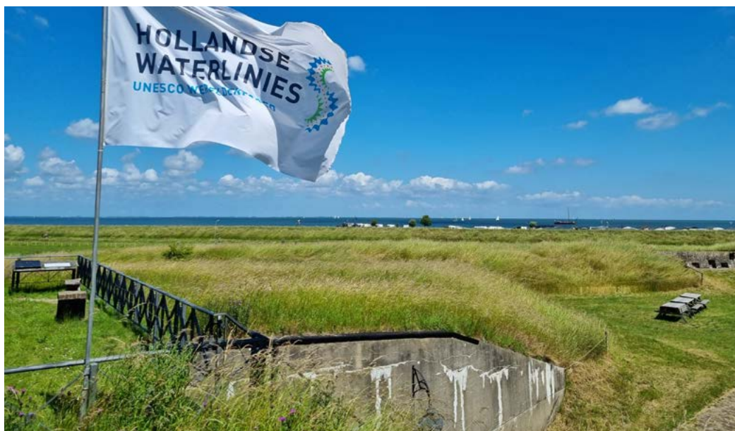
De vlag wappert op Fort bij Edam