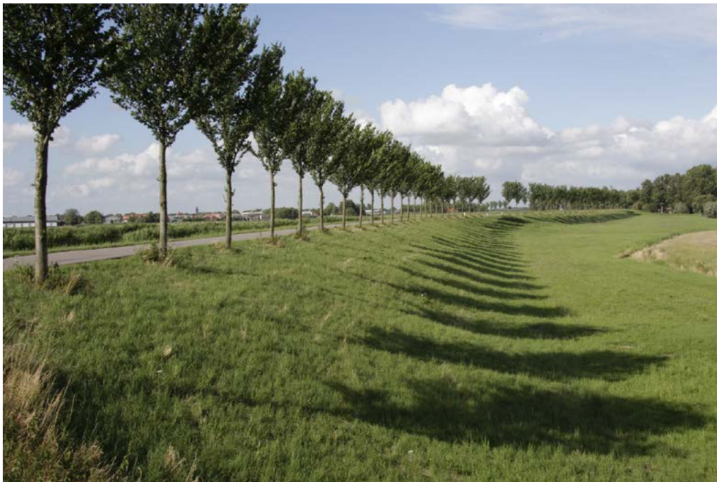
Bomenrij Fort bij Spijkerboor in Droogmakerij de Beemster