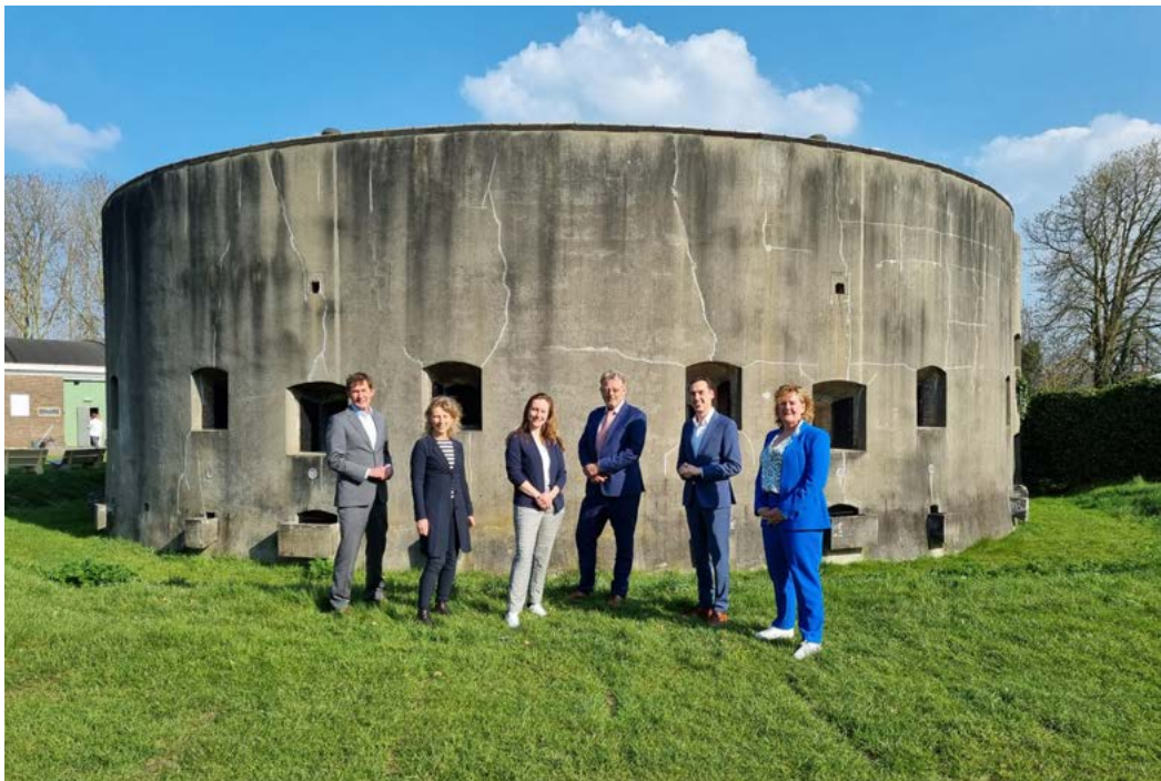
Oprichting Gemeenschappelijk Orgaan Hollandse Waterlinies op 24 maart 2022.

De gemeenten in Noord-Holland waar het werelderfgoed binnen het grondgebied ligt, vervullen een belangrijke rol bij het beschermen van de OUV van het werelderfgoed. Dit doen zij via het ruimtelijk beleid maar ook via de bescherming van zowel de rijks- als provinciale monumenten. Gemeenten zijn namelijk bevoegd gezag voor de monumentenbescherming. In overleg met gemeenten stellen wij gebiedsanalyses op om de actuele regionale kernkwaliteiten van het werelderfgoed te beschrijven en geven daarbij