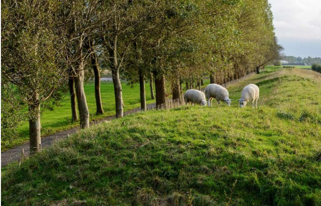
Vuurlinie Wijkertocht