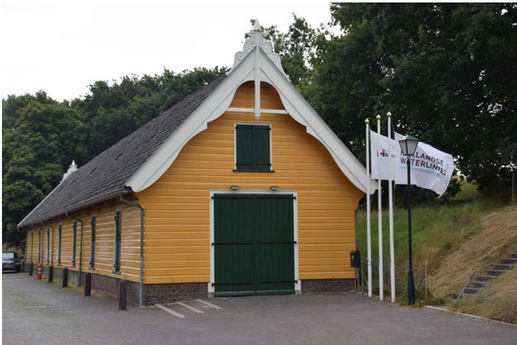
Gele Loods in Naarden

informatiepunten gekomen over de Stelling van Amsterdam. In het Muizenfort is daarnaast een informatiepunt over de Vesting Muiden en de Stelling van Amsterdam met steun van de provincie Noord-Holland geopend. In de Gele Loods in Naarden is een informatiepunt over de Vesting Naarden en de Hollandse Waterlinies gerealiseerd. Tot slot is in fort K'ijk een belevingscentrum geopend." Verder zijn we aangehaakt aan het NBTC-programma ' Ode aan het Landschap '. Vanwege de coronacrisis is helaas een aantal activiteiten van dit programma opgeschoven in de tijd en/of in aangepaste vorm uitgevoerd. Tevens heeft de focus zich noodgedwongen gericht op de binnenlandse bezoeker. Hierdoor zijn we er niet in geslaagd om meer bezoekers uit het buitenland te trekken. Of er meer binnenlands bezoek is aan de Stelling is moeilijk te meten, omdat het aantal wandelaars en fietsers niet wordt geteld. In de afgelopen periode is tot slot zowel de Langeafstand Fietsroute Hollandse Waterlinies (LF Waterlinieroute) als een Lange-Afstand-Wandelpad (LAW) gerealiseerd langs de Stelling van Amsterdam en de Nieuwe Hollandse Waterlinie.