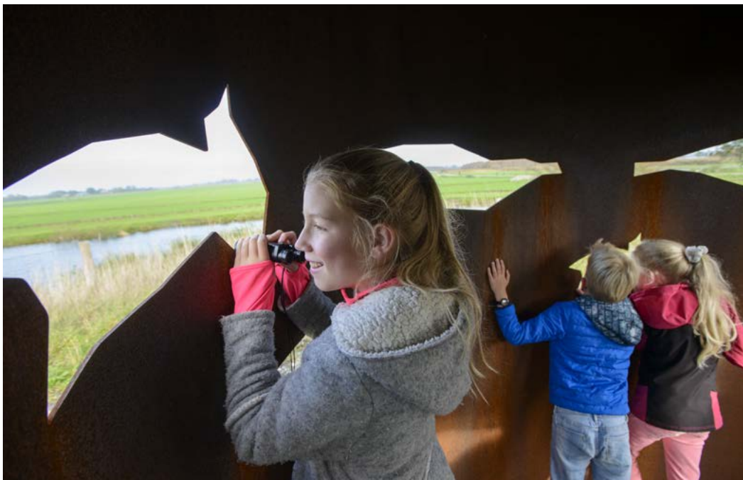
Blik op de toekomst, Fort bij Krommeniedijk

Naast de Reserve Stelling van Amsterdam is een structureel bedrag van € 650.000,- per jaar in de provinciale exploitatiebegroting opgenomen voor de Hollandse Waterlinies opgenomen. Hieruit bekostigen we onze bijdrage aan het gemeenschappelijk orgaan van € 300.000,- per jaar. Daarnaast verlenen we opdrachten voor onderzoek en advies uit dit budget en financieren we de kleinere projecten. De activiteiten en maatregelen van de doelen kernkwaliteiten beschermen, uitdragen en beleefbaar maken, en koppelen maatschappelijke doelen uit hoofdstuk 5 betalen we dus uit het exploitatiebudget.