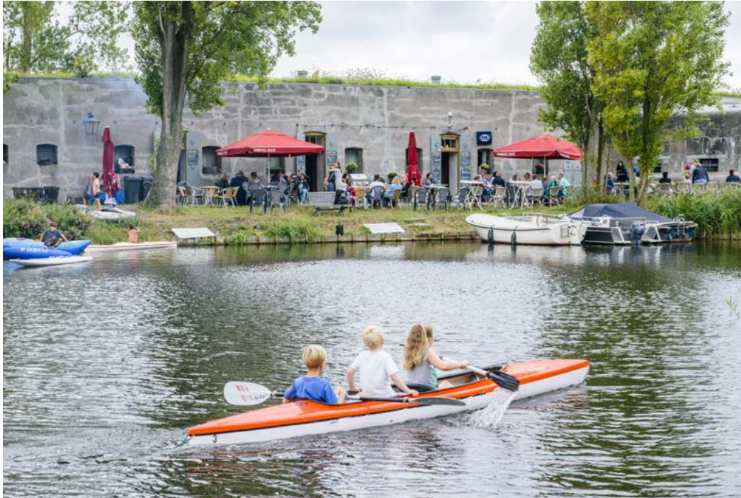
Kanoërs Fort bezuiden Spaarndam