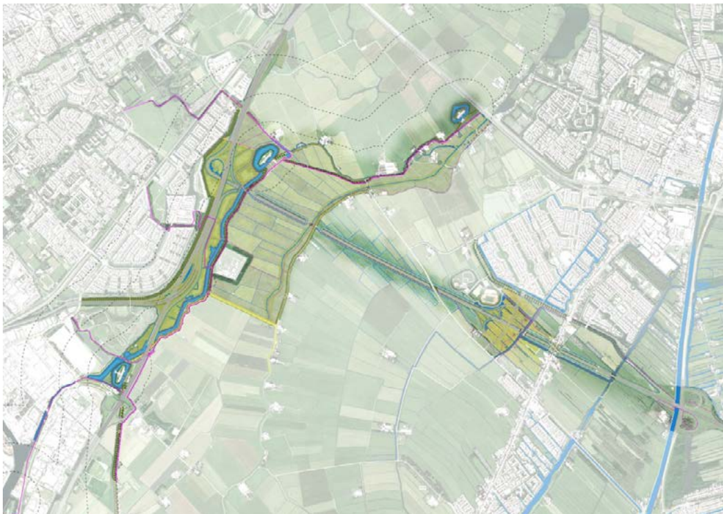
Maatregelen landschapsplan A8 – A9 etc.

Ad e. Het natuurbeleid van de provincie Noord-Holland richt zich op het versterken van de natuurwaarden binnen de NNN gebieden. Voor landschap is ons beleid in het Bijzonder Provinciaal Landschap (BPL) belegd. De Hollandse Waterlinies kennen op een aantal plekken een overlap met het NNN en het BPL. Daar waar deze overlap zich bevindt onderzoeken wij of er kansen zijn van koppeling tussen natuur- en landschapsdoelen en het beleefbaar maken van het verhaal van het werelderfgoed. Een mooi voorbeeld hiervan is het jaarlijks verhogen van het waterpeil van de weilanden rond Fort bij Krommeniedijk. Hierdoor is de inundatie van de Stelling van Amsterdam beleefbaar en profiteren weidevogels van de vernatting van het weiland. Door het verhogen van het waterpeil komen wormen aan de oppervlakte die een lekker maaltje vormen voor de weidevogels die op doorreis zijn naar hun eindbestemming.