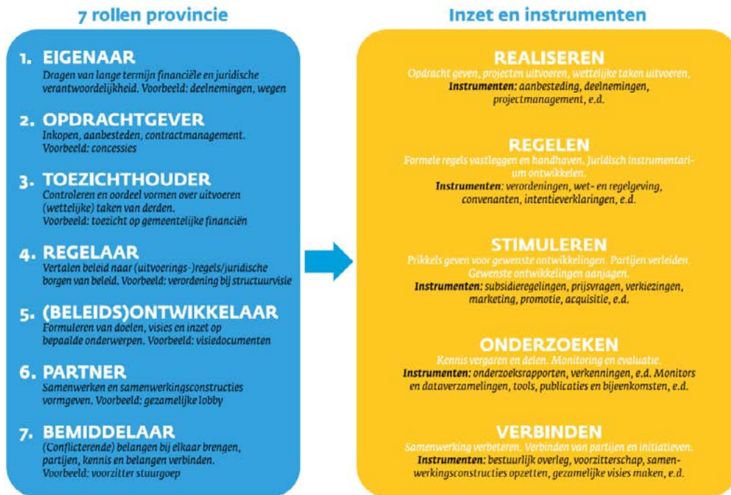
Afbeelding 1. Overzicht rollen en instrumenten