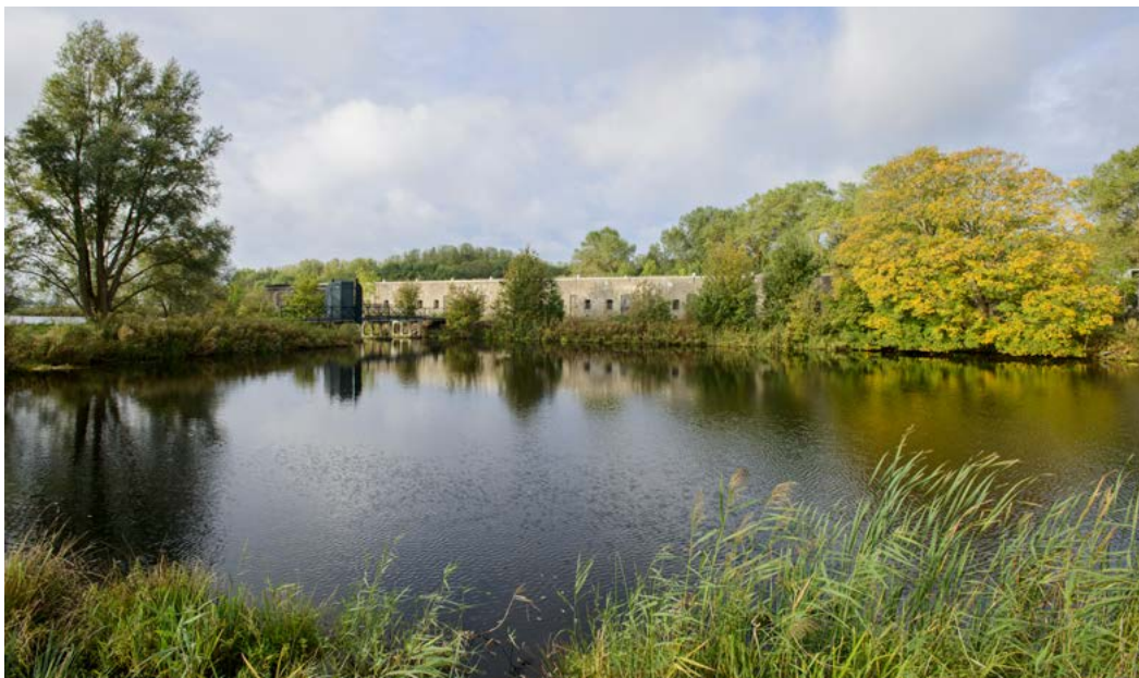
Fort benoorden Spaarndam