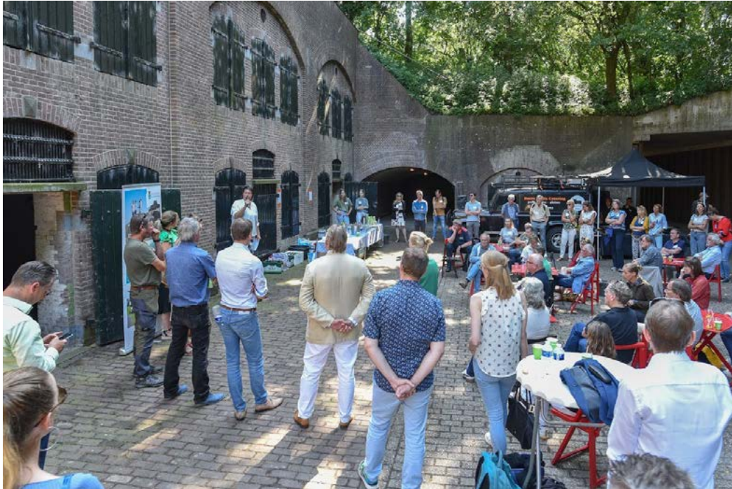
Netwerkbijeenkomst Liniebreed Ondernemen (Fort bij Abcoude, juni 2022)