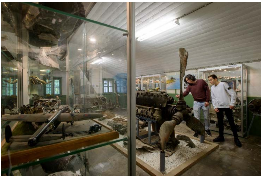
Luchtoorlogmuseum Fort bij Veldhuis

Ad c. De provincie heeft een Visie Recreatie & Toerisme 2030 . Deze visie is strategisch van aard. De visie beschrijft de belangrijkste kansen en uitdagingen op het gebied van recreatie en toerisme voor Noord-Holland op de middellange termijn (2030) en geeft richting aan de aanpak van deze uitdagingen en de rol die we hierin vervullen. Deze strategie zet de bestemming centraal. Dit houdt in dat de provincie inzet op bestemmingsmanagement (software kant) en bestemmingsontwikkeling (realiseren van koppelkansen voor recreatie en toerisme). Zowel op het gebied van bestemmingsmanagement als -ontwikkeling formuleren wij activiteiten in dit uitvoeringsprogramma.