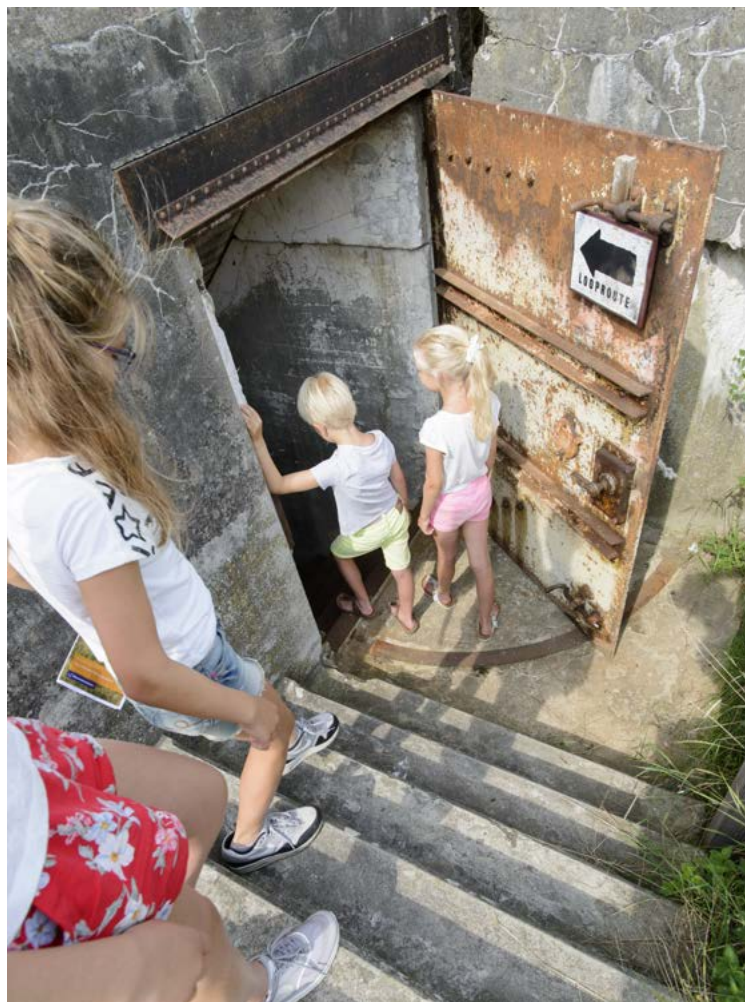
Fort bij Spijkerboor