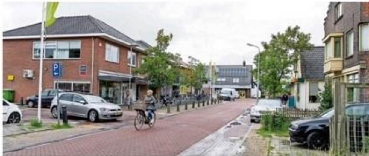
De Bovenweg van Sint Pancras. Nu nog gemeente Dijk en Waard, straks Alkmaar?

Spaans: „Een dorpsraad... Dat willen we! Nog een reden om naar Alkmaar te gaan.“